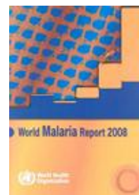
World Malaria Report 2008