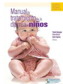
Manual de tratamiento de la diarrea

Newsletter Office of Director No. 1 2009